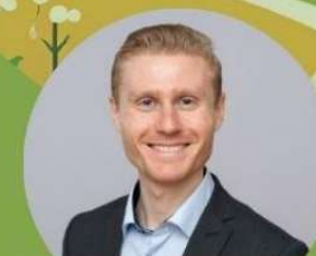
Gregor BILEY NHP Rechtsanwälte