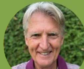
Willi KLEMENJAK ABATT Handels GmbH